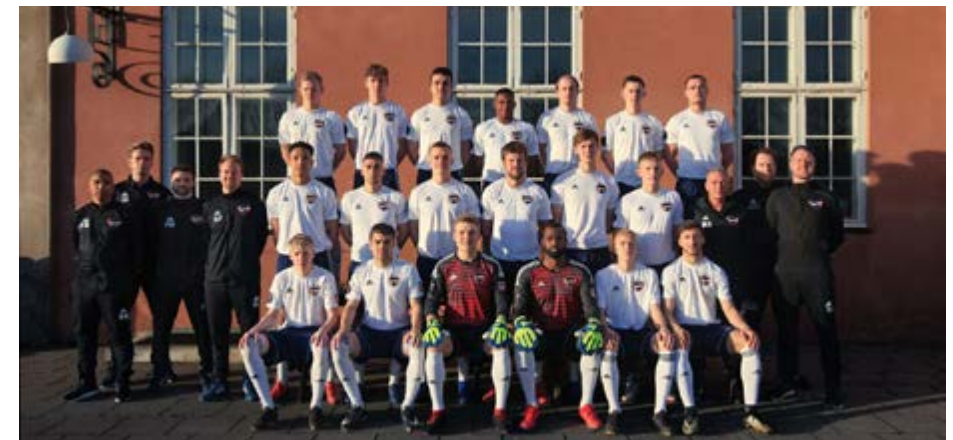
1. herresenior