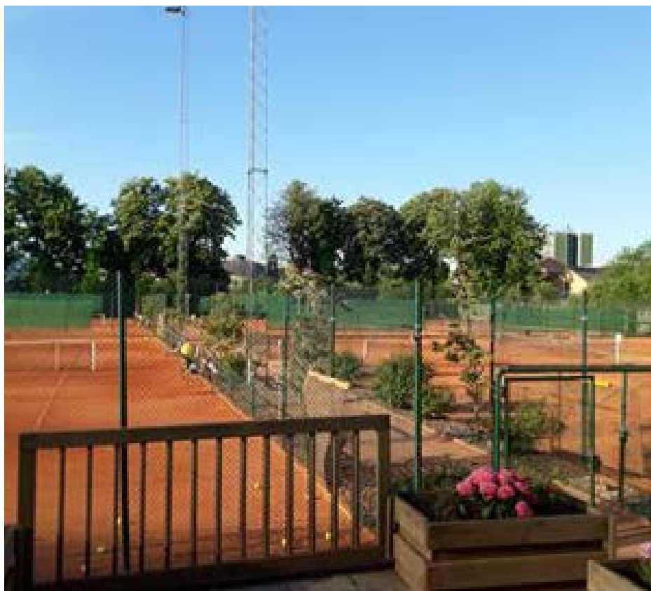
Tennis nyt anlæg

Succesen i seniorafdelingen er til at føle på: I år er STU oppe på 308 aktive seniorspillere – sidste år på samme tidspunkt var tallet 153.