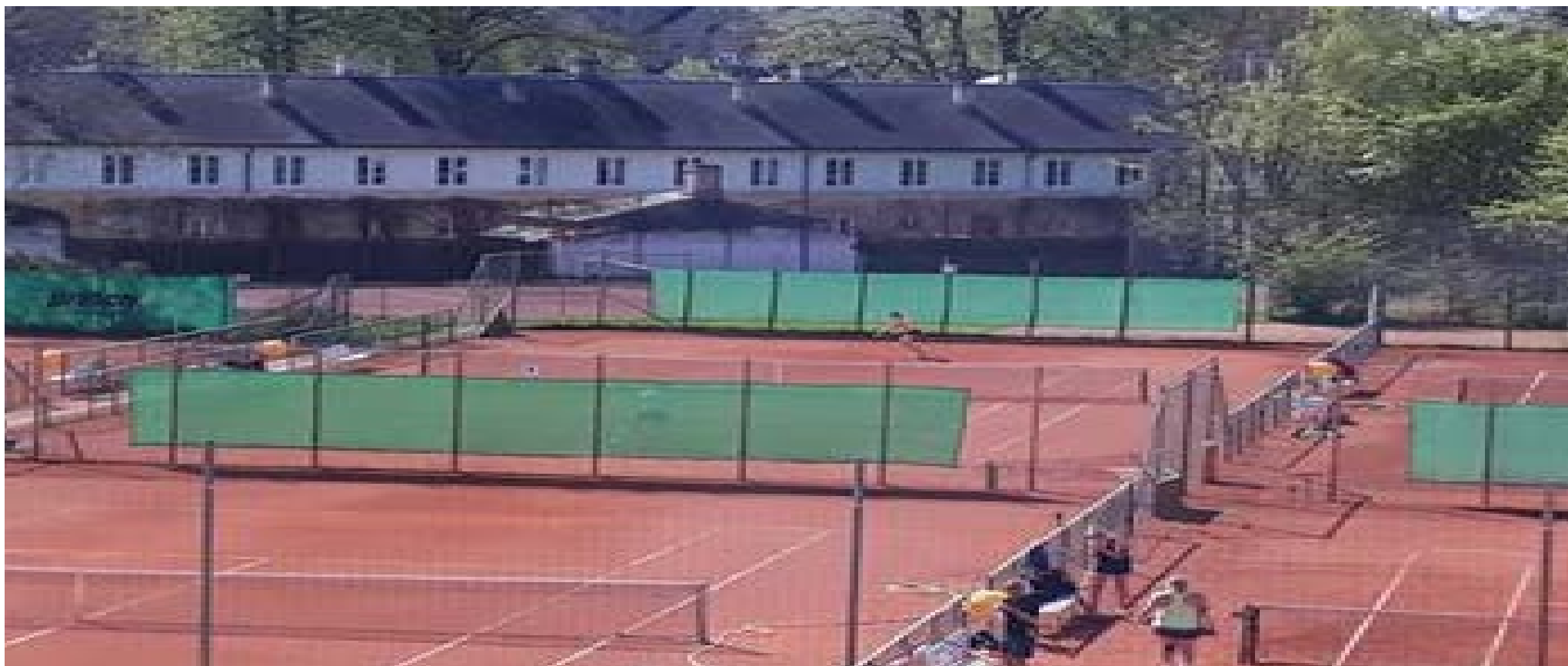
Tennis gammelt anlæg

I holdturneringerne måtte vores damer helt som ventet en tur ned i den næstbedste række, men som nævnt i sidste medlemsblad er der masser af grøde på ungdomssiden i dameafdelingen, så mon ikke de på længere sigt får mulighed for at etablere sig i den bedste række? Herrerne har i hele sæsonen kæmpet i den tunge ende af den næstbedste række, men i den afgørende kamp for at undgå nedrykning var der ingen slinger i valsen. Bakket op af mange tilskuere i hallen takket være et fornemt arrangement, som tennisafdelingen havde stablet på benene, blev naboerne fra Ryvang sendt over på den anden side af Nordhavnsmotorvejen med en sæk på 5-1.