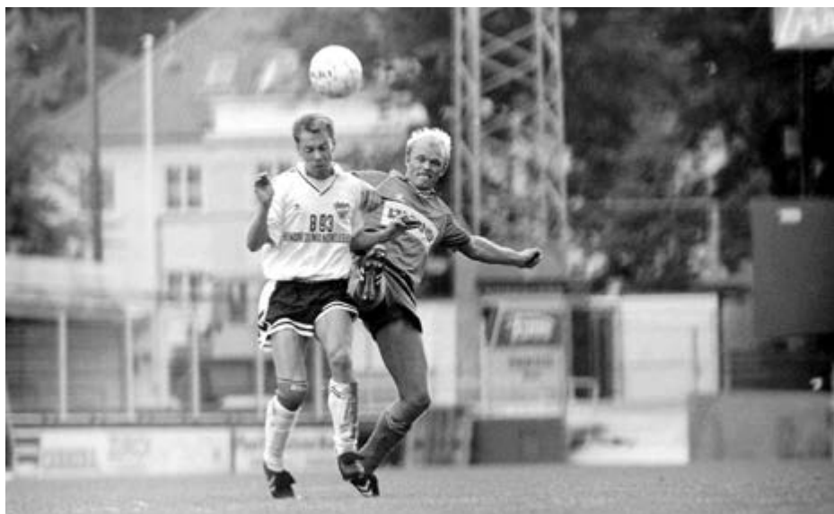
B.93 Nørresundby

Før vi kommer til målet, skylder vi lige lidt information til eventuelt yngre læsere af dette blad: På den grund, hvor Telia Parkens charmeforladte betonfirkant nu huser en eller anden fusionsklubs hjemmekampe og muligvis også en enkelt landskamp i ny og næ, lå der indtil 1990 et prægtigt fodboldstadion uden kontorer og VIP-loger og med en enestående stemning, når omkring 45.000 tilskuere var tæt pakket sammen på de gamle tribuner. Stadionet var kommunalt ejet, så det var muligt for alle københavnerklubber at