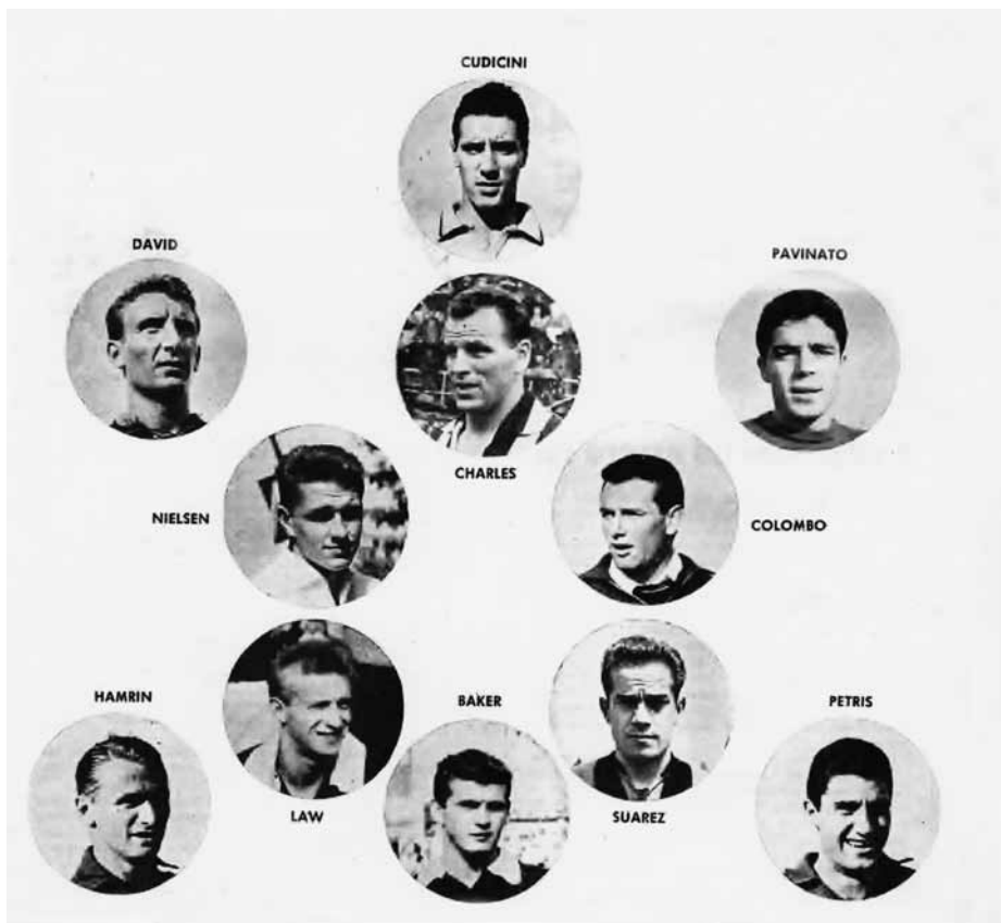
Flemming på det italienske ligahold – i fint selskab.