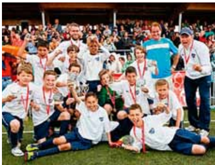
Klubbens dygtige U 11 hold vinder Cordial Cup i Wien med en finalsejr over selveste Bayern München