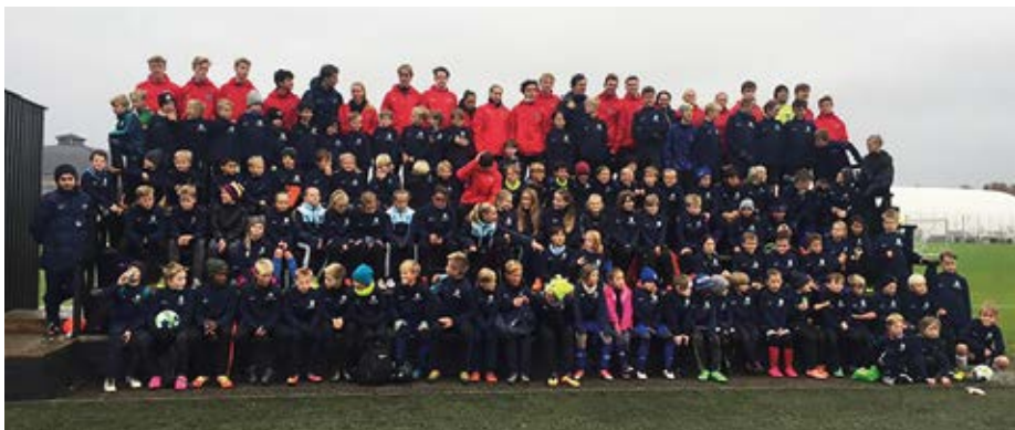
Deltagerne ved efterårets football camp