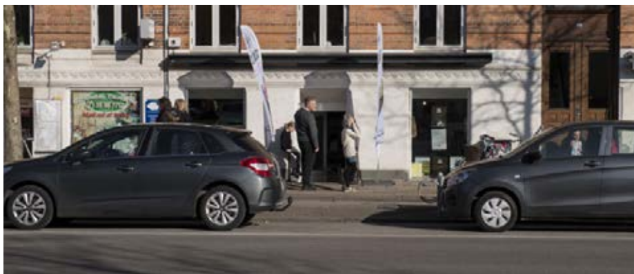
Forretningen på Østerbrogade 128

Social Foodies har i dag fem butikker på henholdsvis Gammel Kongevej 115, Ordrupvej 42, Østerbrogade 128, Strandvejen 187 og M.P. Bruuns Gade i Aarhus. Tilskuerne til kampen B.93– Frem har haft mulighed for at smage forretningens hjemmelavede isprodukter og redaktøren og hans hustru kan varmt anbefale de hjemmelavede flødeboller.