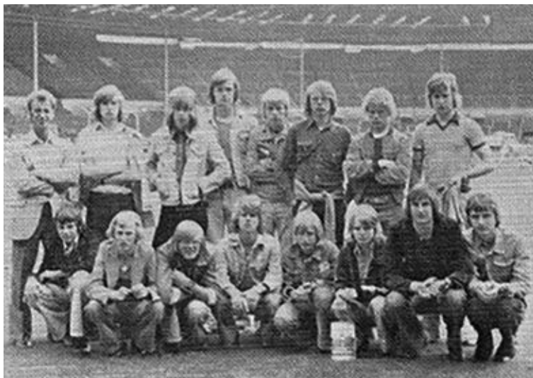
1. junior var på besøg på Wembley, England 1975

Målet er nu at få holdet til at kvalificere sig til oprykningsspillet forår 2017. Medlemsbladet ønsker Ole held og lykke med projektet.