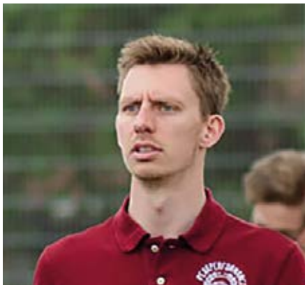
Allan Bisgaard

„Fodbolden betyder alt for Dexter, og selv om vejret måske ikke har været det allerbedste, så har det ingen betydning haft for Dexters lyst til at træne.“