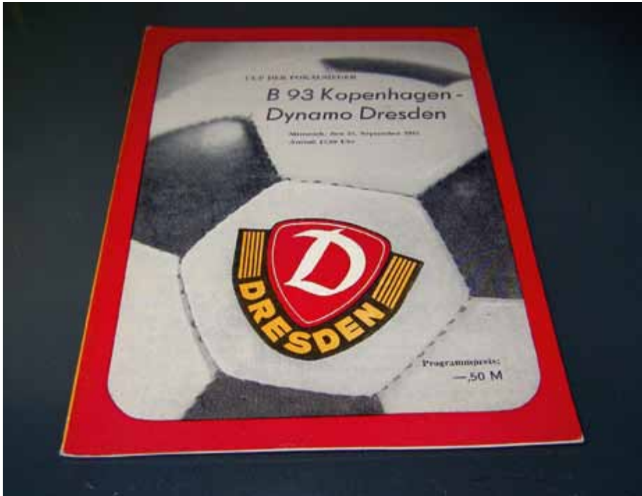
Programmet fra kampen i Dresden.

de havde lært og holdt da også østtyskerne fra yderligere scoringer inden pausen.