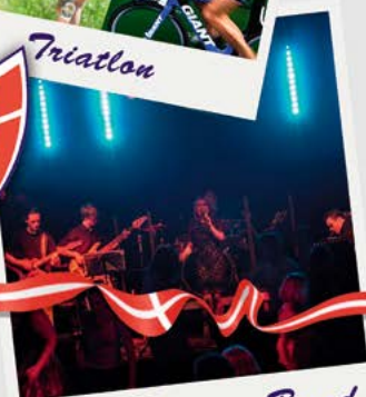
Hit it live - Band