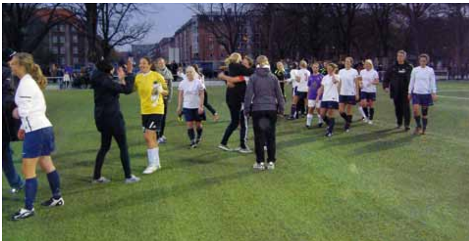
Jublende spillere efter semifinalesejren over Viborg.