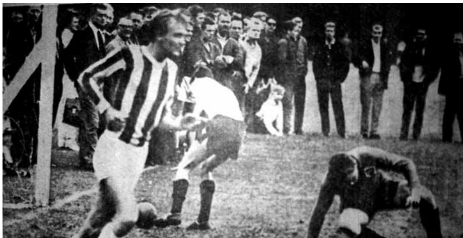
Fra pokalkampen i 1964 Brønshøj - B.93 (6-1)