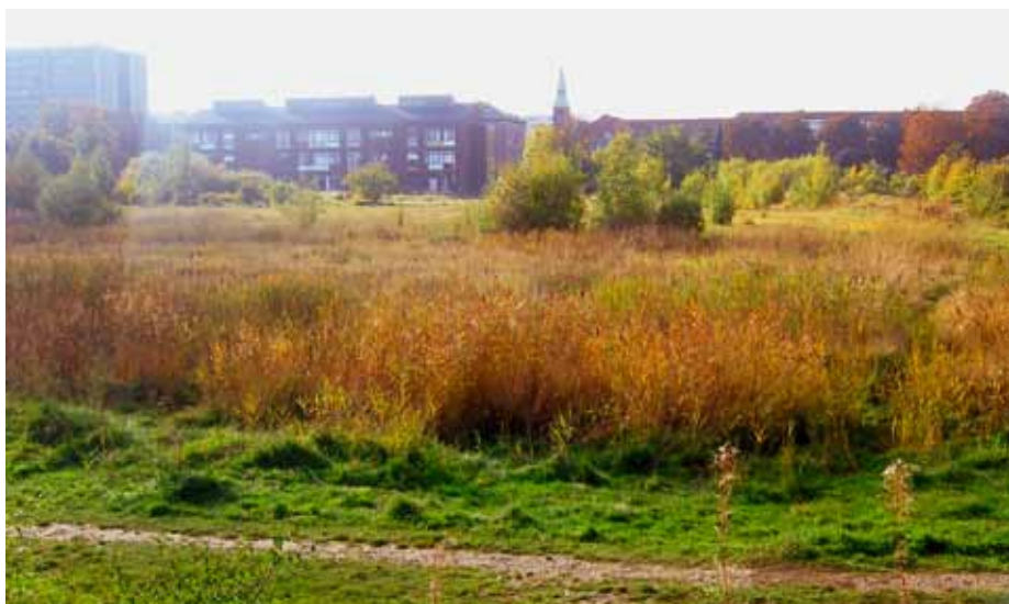
Billede af Gasværksgrunden

På grunden vil der tillige være plads til to 11-mands fodboldbaner, der vil afhjælpe vores anlæg betydeligt og skabe plads til de mange nye medlemmer, vi forventer at få i den kommende tid. Vi siger plads for dem alle, plads for alle, der vil. /Redaktionen