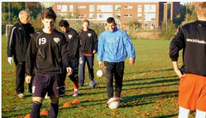
Akademiet træner

Projektet blev søsat august 2009, hvor atletikklubben Sparta og B.93 var med fra start. I 2010 er der også åbnet mulighed for håndboldspillere med håndboldklubben Ajax som samarbejdspartner.