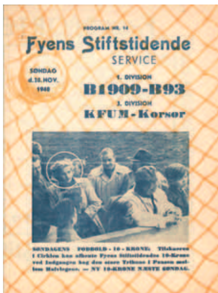
Program fra B.1909 – B.93 28. November 1948

Så fulgte en tid, hvor man var hyppig gæst i Parken. B.93 – Køge kl. 10,00 – KB – B.1903 kl. 13,15 og Frem – AB kl. 15,30. Og man skulle have pro-