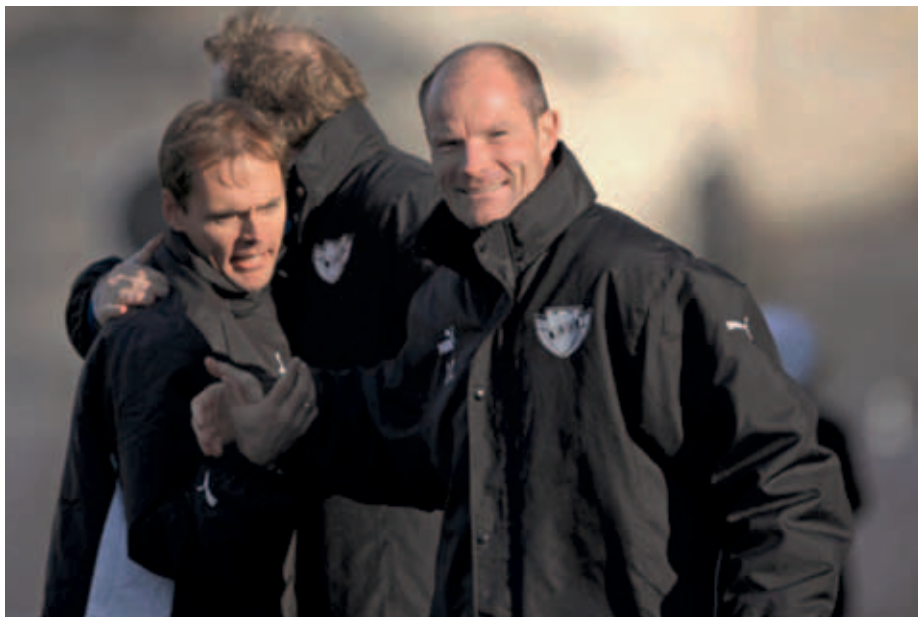
1. holdets trænertrio

kilde. Sponsorer som betaler til B.93 for at blive eksponeret, få nye forretningskontakter blandt de øvrige sponsorer og som gerne vil støtte op vores udvikling af talentfulde fodboldspillere. Udfordringen med at tiltrække nye sponsorer blev bestemt ikke nemmere af, at tennisafdelingen valgte at erklære krig mod hovedbestyrelsen i fuld offentlighed. Hjemmesiden blev taget som gidsel i bestræbelser på at vinde gehør for synspunkter, og Østerbro Avis åd denne uenighed råt. Jeg skal ikke gå ind sagens detaljer og forsøge at vurdere, hvem der har ret eller uret men blot beklage, at sådanne uenigheder ikke løses internt i klubben og ikke i pressen og på vores hjemmeside. Det har sat vores sponsorarbejde tilbage og dermed indirekte skadet også vores 1. hold og ungdomselite.