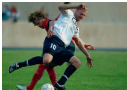
Baunsgaard i kamp for oprykning i skæbnekampen mod Brabrand.

Sidste sæson endte skuffende pga. den manglende oprykning i tolvte time. Men Geert vil alligevel fremhæve hele sæsonen, som værende den bedste oplevelse han har haft i B.93-trøjen: „Hele min første sæson var en oplevelse i vindermentalitet. Selvom udfaldet ikke blev som vi