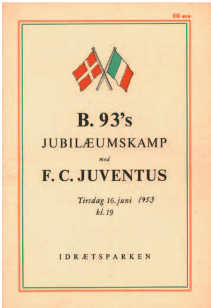
B.93 – Juventus – program fra jubilæumskampen i 1953 (1-2)