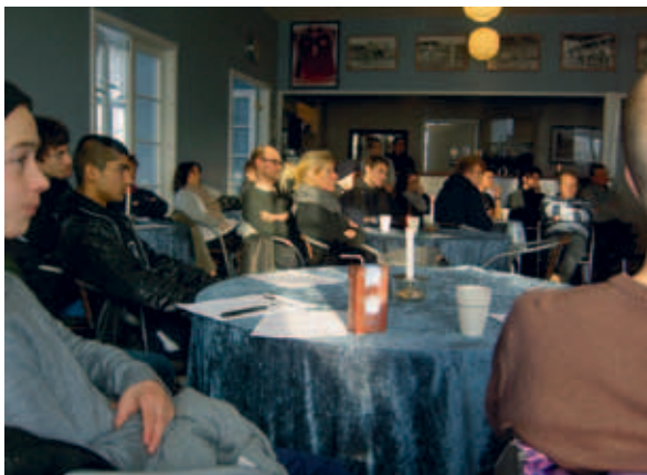
Fra informationsmøde om Team Copenhagen