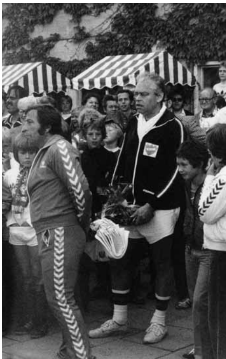
Dirch Passer deler præmier ud til en B.93 cup'en