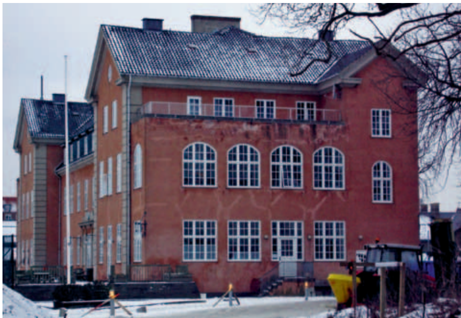
B.93's klubhus „Slottet“