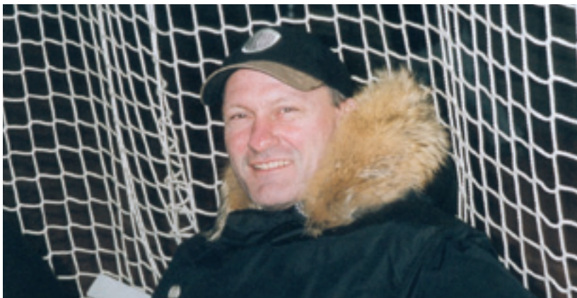
Elkjær i nettet