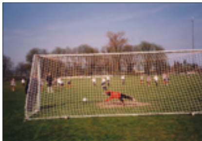
Der er skænket nye målnet til Svanemølleanlægget fra Børge Christensens mindelegat