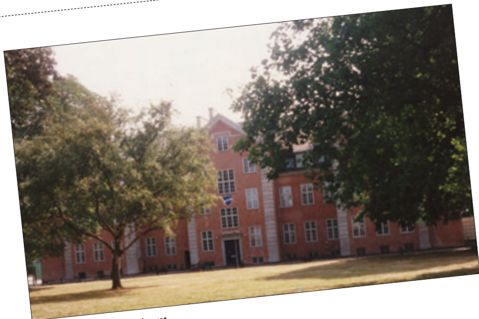
Klubhuset på Svanemølleanlægget