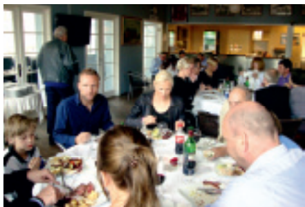
Billed fra arrangement

Vi har genindført forkampe med de små hold, som starter hjemmekampene og det er bestemt meget underholdende og værd at bakke op om