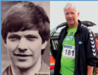
Skovbjerg anno 2011