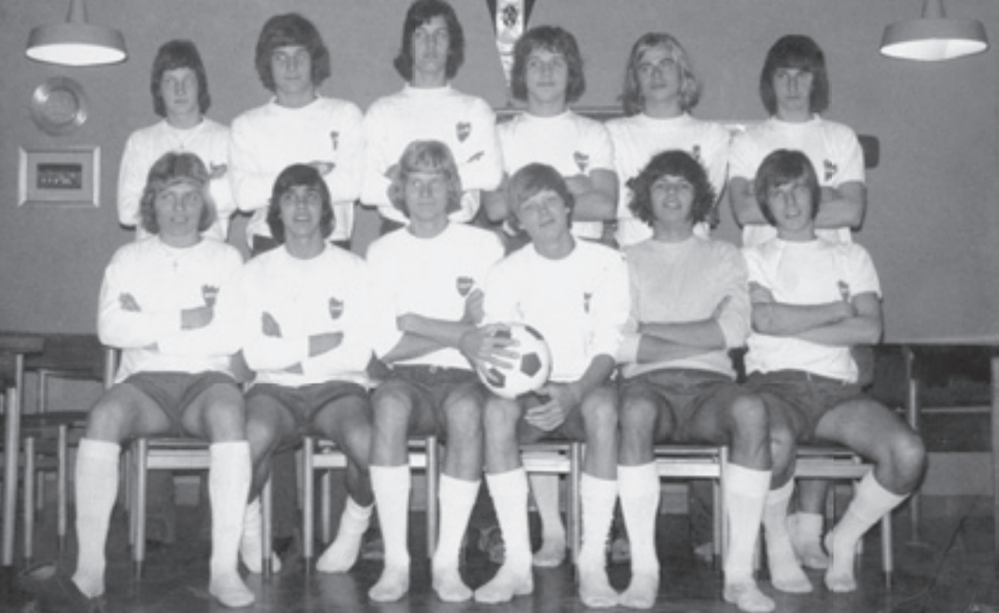
Holdbillede 1. Ynglinge England 1972