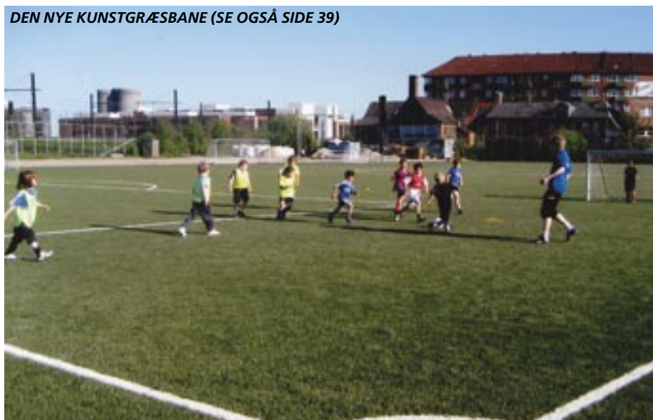
DEN NYE KUNSTGRÆSBANE (SE OGSÅ SIDE 39)

Isommerferien vil alle banerne dog gennemgå en større renovering. Der er en god kommunikation nu mellem Kommunen og klubben omkring de indgåede renoveringsaftaler.