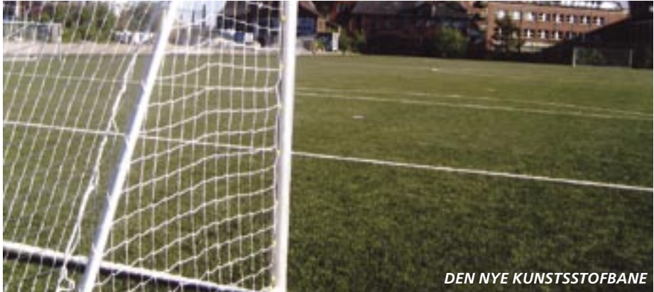
DEN NYE KUNSTSTOFBANE