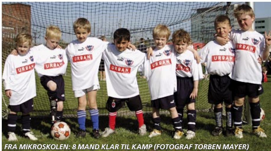
FRA MIKROSKOLEN: 8 MAND KLAR TIL KAMP