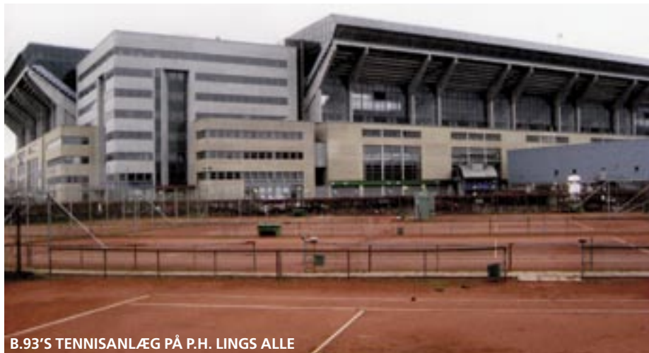
B.93'S TENNISANLÆG PÅ P.H. LINGS ALLE

B.93 har været meget aktiv for at samle idrætsklubberne på Østerbro omkring en fælles holdning, og det har tilsyneladende skabt resultater.